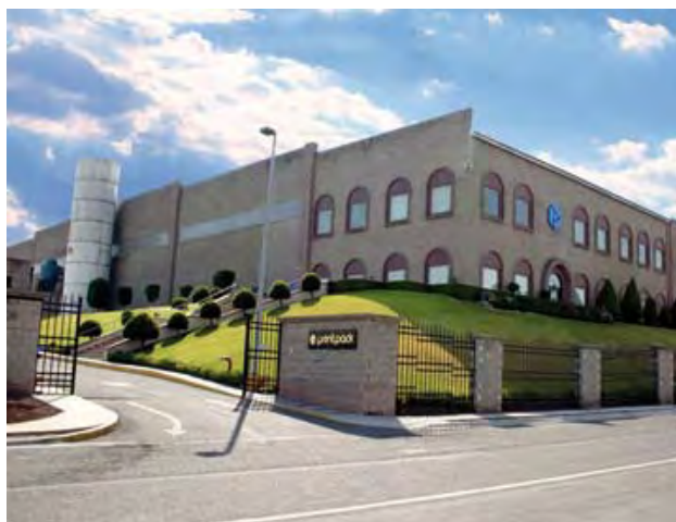
Printpack Packaging de México, S.A. de C.V.

En la primera evaluación realizada al centro de trabajo, se obtuvieron calificaciones de 97 por ciento en la instauración del Sistema de Administración en Seguridad y Salud en el Trabajo, SASST, y de cien por ciento, en el cumplimiento de la normatividad en la materia.