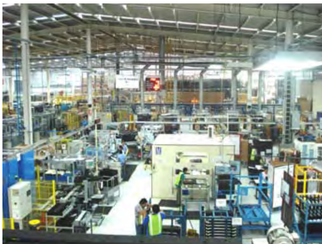
Automotive México Body Systems, S. de R.L. de C.V.

En la primera evaluación realizada al centro de trabajo, se obtuvieron calificaciones de 92 por ciento en la instauración del Sistema de Administración en Seguridad y Salud en el Trabajo, SASST, y de 98 por ciento, en el cumplimiento de la normatividad en la materia.