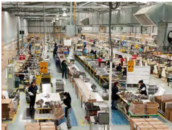
BHA Group Servicios, S.A. de C.V.

Antes de incorporarse al Programa de Autogestión en Seguridad y Salud en el Trabajo, PASST, la empresa contaba con prácticas relativas a la seguridad, salud y protección ambiental.