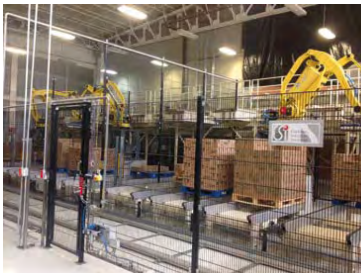
Unilever Mexicana, S. de R.L. de C.V. -Planta Lerma-

Unilever Mexicana, S. de R.L. de C.V. -Planta Lerma-, se inscribió al Programa de Autogestión en Seguridad y Salud en el Trabajo, PASST, en mayo de 2004. Sin embargo, siempre ha considerado como fundamental, dentro de su política, el compromiso de proteger el medio ambiente, sus empleados y la comunidad donde opera.