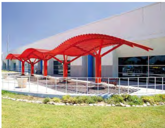
Smiths Healthcare Manufacturing, S.A. de C.V.

Smiths Healthcare Manufacturing, S.A. de C.V., formalizó el compromiso voluntario el 17 de agosto de 2001, con 88.9 por ciento en la evaluación del funcionamiento del Sistema de Administración en Seguridad y Salud en el Trabajo, SASST; 93.8 por ciento, en el cumplimiento de la normatividad en seguridad y salud en el trabajo, y una tasa de 1.89 accidentes por cada cien trabajadores.