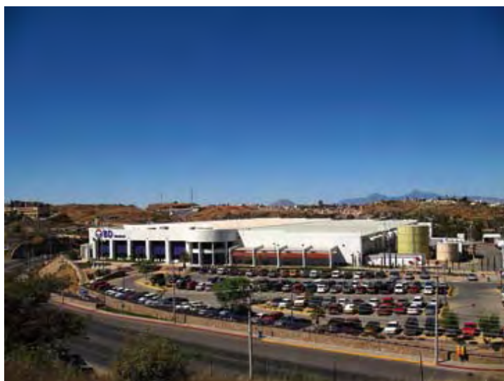
Becton Dickinson Infusion Therapy System Inc, S.A. de C.V.

Antes de incorporarse al Programa de Auto-gestión en Seguridad y Salud en el Trabajo, PASST, la empresa contaba con prácticas relativas a la seguridad, salud y protección ambiental.