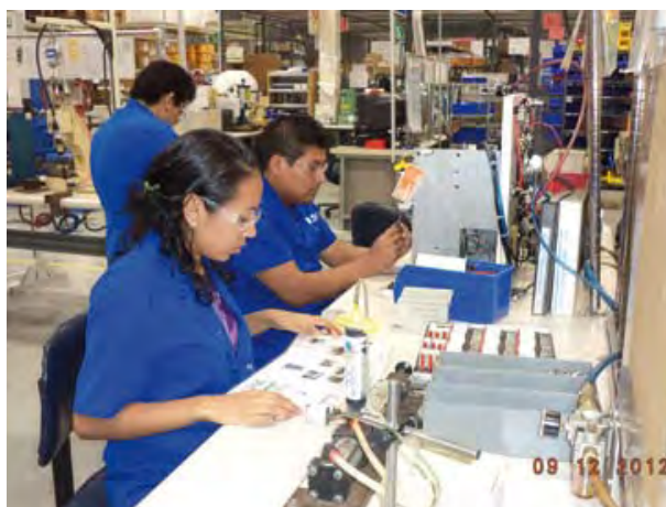
Eaton Controls, S. de R.L. de C. V.

Con el Programa de Autogestión en Seguridad y Salud en el Trabajo, PASST, se ha mejorado el involucramiento del comité de dirección, mandos medios y personal operativo; han sido implementados indicadores específicos para evaluar el cumplimiento normativo y los