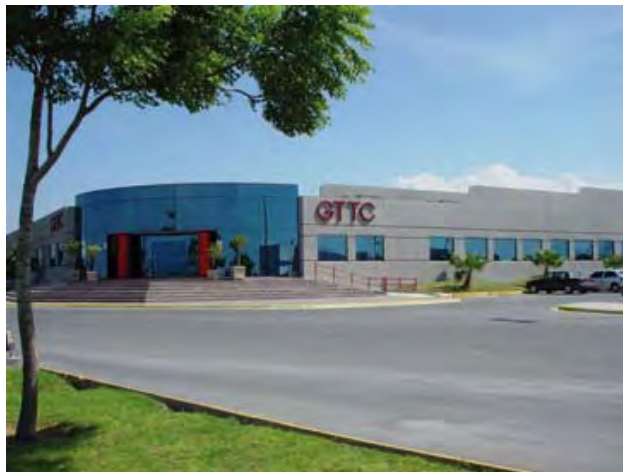
GE Toshiba Turbine Components de México, S. de R.L. de C.V.

El autodiagnóstico ha sido de gran utilidad como guía para evaluar el grado de cumplimiento de las normas oficiales mexicanas de seguridad y salud en el trabajo que deben observarse en el centro laboral.