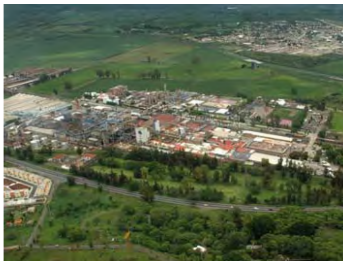
Grupo Celanese, S. de R.L. de C.V. -Complejo Ocotlán-

En marzo de 2000, la empresa formalizó el compromiso voluntario para su incorporación al Programa de Autogestión en Seguridad y Salud en el Trabajo, PASST, con una calificación inicial de 95.2 por ciento en la instauración del Sistema de Administración en Seguridad y