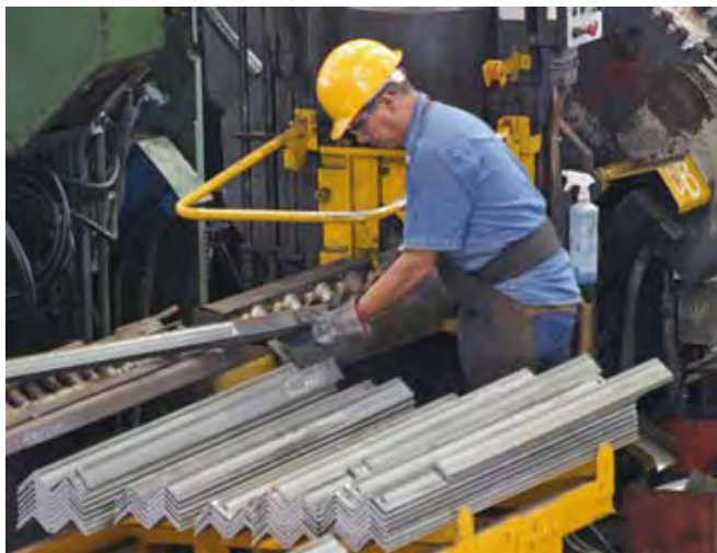
Sae Towers México, S. de R.L. de C.V.

La empresa se incorporó al Programa de Auto-gestión en Seguridad y Salud en el Trabajo, PASST, en el año 2001, con los resultados