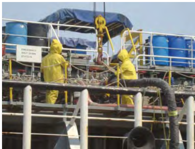
Grupo Celanese, S. de R.L. de C.V. -Terminal Marítima-

Antes de incorporarse al Programa de Auto-gestión en Seguridad y Salud en el Trabajo, PASST, la empresa sólo contaba con prácticas