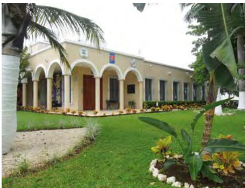
Barcel, S.A. de C.V. -Planta Mérida-

Barcel, S.A. de C.V. -Planta Mérida-, se encuentra ubicada en Calle 60 Diagonal No. 497, Col. Parque Industrial, Mérida, Yucatán, C.P. 97300, y cuenta con una plantilla de 150 trabajadores.