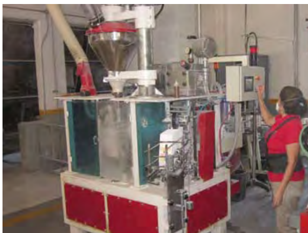
Harinera de Sinaloa, S.A. de C.V.

Harinera de Sinaloa, S.A. de C.V., se encuentra ubicada en Boulevard Emiliano Zapata No. 3198, Col. Industrial Palmito, Culiacán, Sinaloa, C.P. 80160.