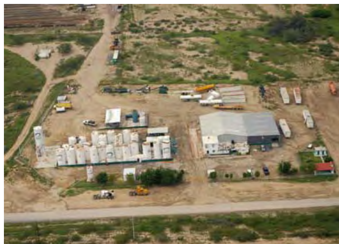
Qmax México, S.A. de C.V. -Planta Comales-

El centro de trabajo se ubica en Carretera Comales - Peña Blanca Km. 1, Col. Comales, Camargo, Tamaulipas, C.P. 88460, en donde laboran 25 trabajadores.